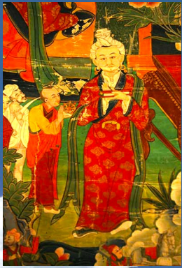
藏文創始人——吞彌桑布札