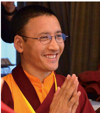
ལྷ་ཚེ་དོན་བཀྲ་ཤིས། 雜縣澤仁札西

格薩爾故事在藏族男女老少中耳熟能詳，就像漢地三國、水滸、西遊。從篇幅上看，也是世界上最龐大一部史詩，史詩故事時空範圍，從吐蕃王朝覆滅後，數百年內群雄割據，互相伐征戰紛的亂年代，地理則是橫跨整大中亞洲，故事牽涉藏族，漢族，大食族（中亞）、回族（喀什），胡人（霍爾），及各區域少數民族，可想見故事內容豐富多樣，嘆為觀止。四、五年前，有線上遊戲公司看上這個特點，還規劃格薩爾亂世英雄時空背景的遊戲做為賣點。