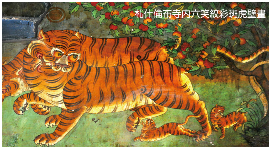
札什倫布寺內六笑紋彩斑虎壁畫