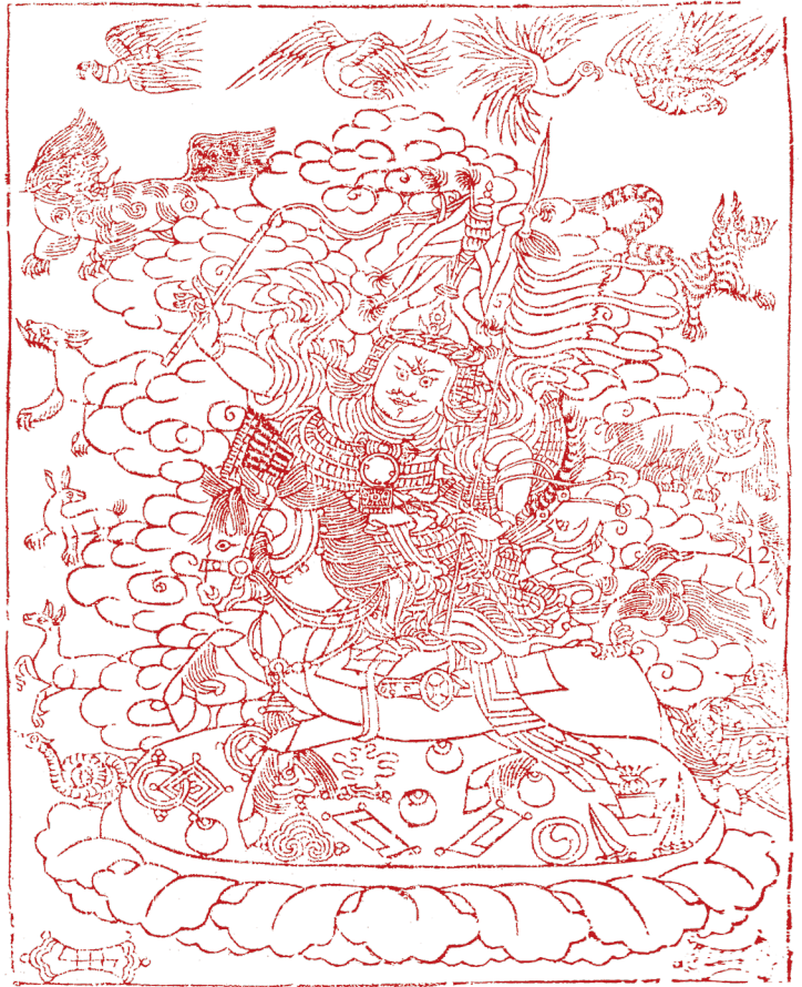
མྱི་དགེ་པར་ཁང་ཚོས་མཛོད་ཆེན་མོའི་ཤེང་བར། 德格藏經院木刻版

格 薩爾諺語特別對學藏文同學來說，是極優良的藏語學習教材。因為格薩爾諺語是詠歌體(མུ་)諺語，歌本身主題明確，有趣而不枯燥，不懂處都估得出意思，有利於自學與查字典修正自己理解。字數不多，每句最多十字以內，無心理壓力。句結構完整，主詞動詞受詞虛詞，多半五臟俱全，特別是虛字使用極明確、不隱晦，當作典型教材範例特別優，讀多了就會虛字了。同時歌內每一句充滿對偶美感，對仗工整，文法上主、動、受、虛詞，其對應位置、停頓點，字數，格式如鏡子對映般，就像讀駢文，讀多反更有趣；藏式抑揚頓挫，音韻美，平仄協調，拿來做初學識字及文法範例，或朗誦，特別適合，最適合當作學習藏傳佛法的文化背景速成教材。以下就舉一些範例，讓同學練習並欣賞。